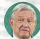
Andrés M. López O.

Visita al municipio de Aguililla, Michoacán, prepara el presidente Andrés Manuel López Obrador. Después de la elección de este domingo se dará a conocer la fecha de la gira en esa comunidad, copada por grupos de la delincuencia organizada. Se trata, nos dice, de buscar junto con los habitantes y autoridades locales soluciones para pacificar la zona.