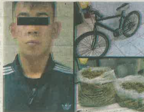
Pedaleaba cuando lo vieron con las bolsas de mota y luego, luego le cayó la ley

Ante esta situación y para descartar un hecho delictivo, los oficiales lo interceptaron y le requirieron una revisión precautoria, como lo indica el protocolo de actuación policial, resultado de la cual, al interior de las dos bolsas de plástico, se halló un aproximado de cuatro kilogramos de aparente marihuana.