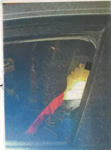
El crimen ocurrió en la colonia Olivar del Conde, en la alcaldía Álvaro Obregón

Tomaron un registro fotográfico del automóvil, la víctima y recolectaron dos casquillos percutidos; el cadáver de la víctima fue llevado al anfiteatro correspondiente para continuar con las diligencias.