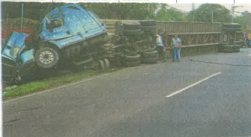
Se afectó la circulación de la carretera federal México-Toluca por más de seis horas ante la volcadura del tráiler con 20 toneladas de cerveza

Socorristas de la Secretaría de Gestión Integral de Riesgos y Protección Civil coadyuvaron para mitigar los riesgos en la zona del siniestro