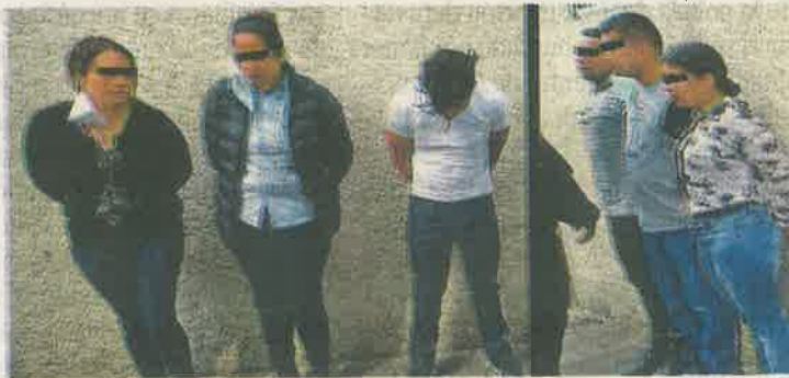
Los implicados fueron trasladados a la Fiscalía Central de Investigación en la colonia Doctores

En medio de un fuerte dispositivo de seguridad, los implicados fueron trasladados a la Fiscalía Central de Investigación en la colonia Doctores en donde se determinará su situación jurídica.