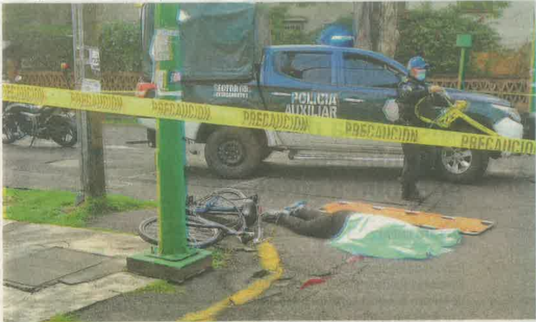
El cuerpo quedó entre Río Bamba y Sierra Vista, en la colonia Lindavista