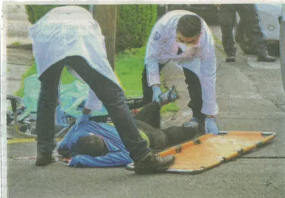
La unidad gasera no pudo frenar ante la salida intempestiva del ciclista