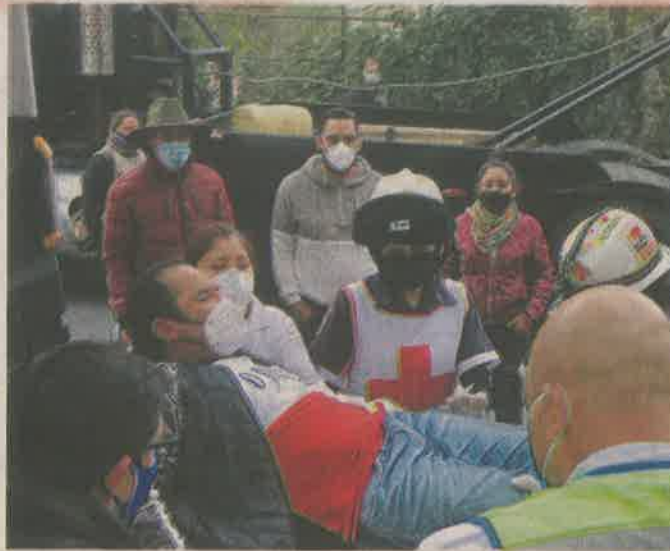
Tras el accidente, 19 personas resultaron lesionadas.

“Yo iba sentado hasta atrás, veníamos bajando de Cuajimalpa y el chofer se vino por acá para evitar el