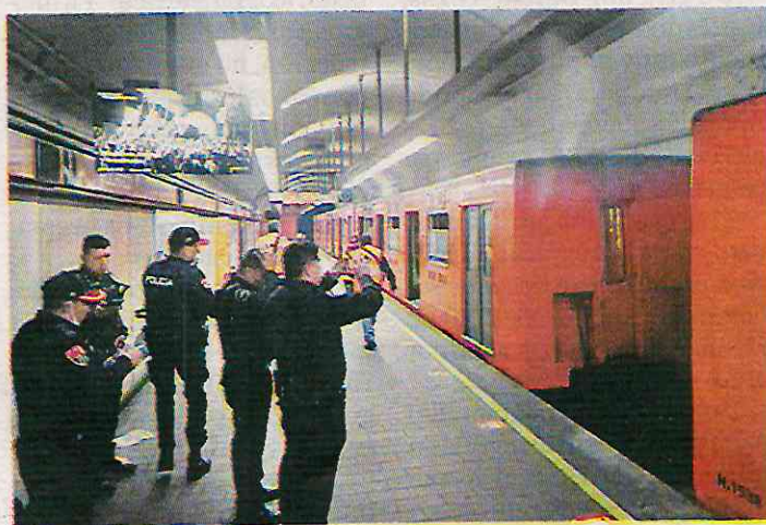
Incidente “atípico” en el STC.

Explicó que los cables más gruesos tienen un peso de entre 7 y 10 kilos por metro, por lo que aquellos que lo roban necesitan tener un gran nivel de organización para llevárselo. —