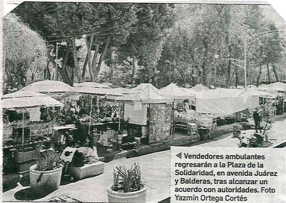
◀ Vendedores ambulantes regresarán a la Plaza de la Solidaridad, en avenida Juárez y Balderas, tras alcanzar un acuerdo con autoridades.

Agregó que desde entonces han solicitado a las administraciones locales un predio para reubicarlos con las mismas condiciones que se han aplicado a otras organizaciones.