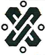
IMAGEN DEL DIA