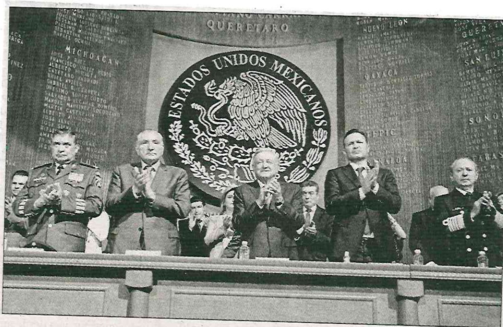
▲ Flanqueado por el gobernador de Querétaro, Mauricio Kuri, así como por los secretarios de Gobernación, Adán Augusto López; de la Defensa, Luis Cresencio

Facebook, Twitter: galvanochoa Correo: galvanochoa@gmail.com