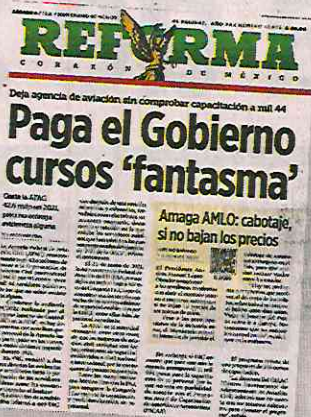
REFORMA publicó el sábado las anomalías en la AFAC.

Sin embargo, estos cursos resultaron ser "fantasma", pues no hay evidencia alguna de que se hayan proporcionado.