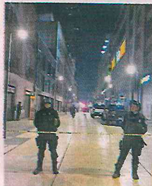
■ Policías restringieron el paso en la escena el homicidio.

Amigos del lesionado, un joven, de entre 25 y 30 años, llamaron al número de emergencias 911, para que recibiera la atención médica; sin embargo, al llegar los paramédicos descubrieron que ya no tenía signos.