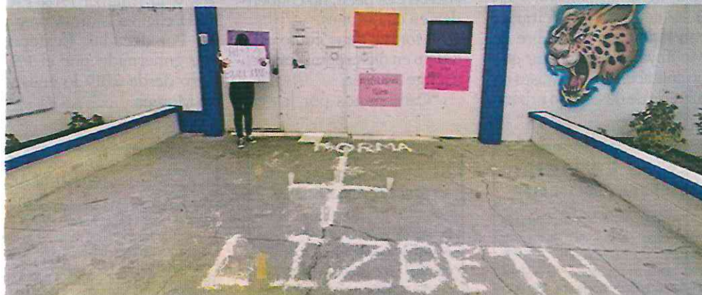
■ En casos de abuso escolar como el de la niña de Teotihuacán, los testigos suelen preferir grabar en vez de intervenir para evitarlo, de acuerdo con el Consejo Ciudadano.