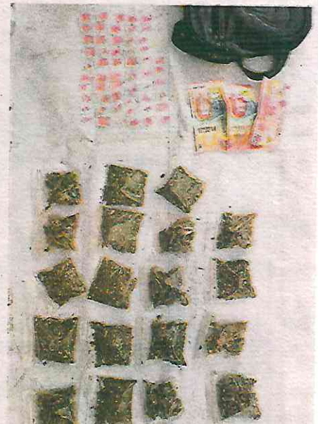
Al ser detenido le aseguraron presuntos narcóticos y dinero en efectivo

nido por elementos adscritos a la misma área de Inteligencia de la Secretaría de Seguridad Ciudadana de la Ciudad de México. Esa organización delictiva se dedica al secuestro, extorsión, cobro de piso, tráfico de armas y venta de drogas en la zona centro de la capital mexicana.