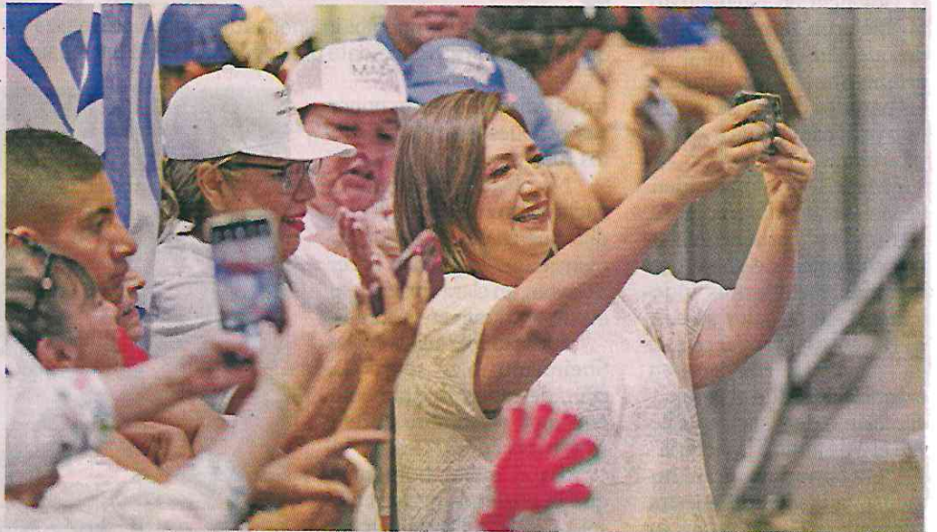
En la Arena de La Paz, BCS, la candidata de la Oposición sostuvo un encuentro con militantes y simpatizantes del PAN, PRD y PRI.

“Es una locura lo que pasa en Cajeme, es una locura lo que vive la gente de Sinaloa después del ‘culiacanazo’, lo que pasa en el País no habla más que de un pacto criminal que hizo Morena y todavía nos recetan su Santa Muerte”.