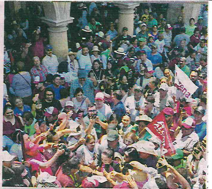
Sheinbaum repartió abrazos, autógrafos y fotografías a su llegada a un mitin realizado en Celaya.

Sheinbaum señaló además que hay una “preocupación especial” en Guanajuato por-