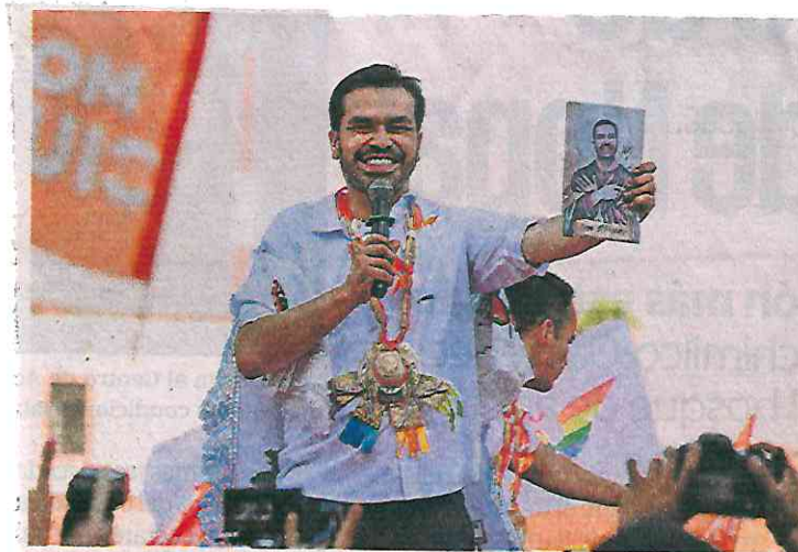
El abanderado de Movimiento Ciudadano se comprometió con los niños a quienes les dijo que los reconocerá como se merecen.

bién agradeció a los niños y las niñas de Michoacán por hacer sonar Presidente Máynez en sus escuelas en el Día del Niño y les prometió que, de ganar en las urnas el próximo 2 de junio, hará su prioridad atenderlos y darles la dignidad y el reconocimiento que se merecen.