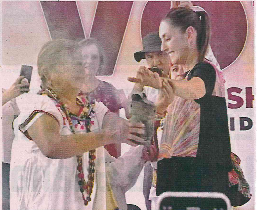
Integrantes de los pueblos indígenas de Guanajuato realizaron un acto ceremonial de purificación a la candidata presidencial Claudia Sheinbaum.

Dirigentes del partido, candidatos y la abanderada de la coalición “Sigamos Haciendo Historia” aprovecharon para arremeter contra el PAN por la inseguridad y la violencia en Guanajuato. Lo hicieron horas después de que -en conferencia- la propia Sheinbaum acusó a