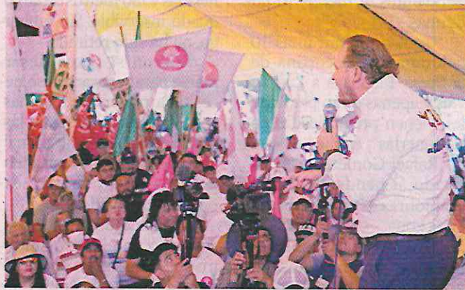
El candidato Santiago Taboada realizó un recorrido en pueblos originarios de la Alcaldía Tláhuac.

Ante habitantes de la comunidad de Andrés Mixquic, Taboada se comprometió a otorgar apoyos al campo a través de maquinaria como tractores, plantas de tratamiento y potabilizadoras.