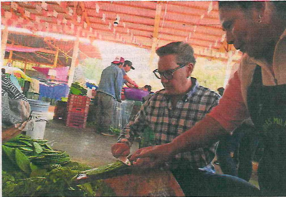
En su visita al Centro de Acopio de Nopal, Salomón Chertorivski también se comprometió a mejorar las condiciones laborales de los productores de Milpa Alta.

“Las últimas tres décadas hemos perdido 40% del bosque, cada día se pierde una hectárea por cultivos ilegales, por asentamientos irregulares, por tala clandestina, necesitamos proteger nuestro bosque”, añadió el abanderado de MC.