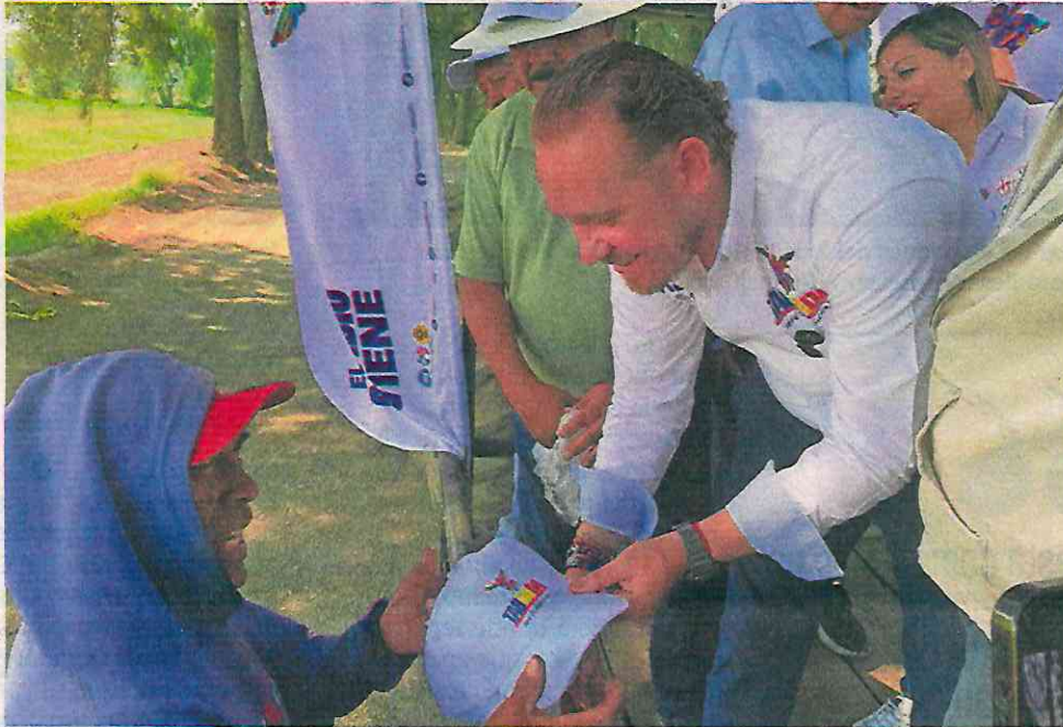
El abanderado del PAN-PRI- PRD, Santiago Taboada, visitó San Andrés Mixquic, San Nicolás Tetelco y San Juan Ixtayopan, donde señaló que se dejó el tema de la seguridad en la alcaldía.