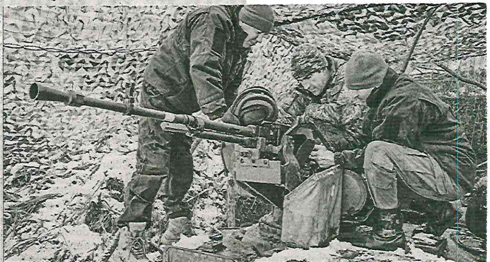
▲ Pese a la “intensidad de la ayuda”, en EU consideran muy “improbable” una victoria

http://alfredojalife.com https://www.facebook.com/AlfredoJalife https://vk.com/alfredojalifeoficial https://t.me/AJalife https://www.youtube.com/channel/UCIfxfOThZDPL_cOLd7psDsw?view_as=subscriber https://vm.tiktok.com/ZM8KnkKQr/ https://twitter.com/AlfredoJalife