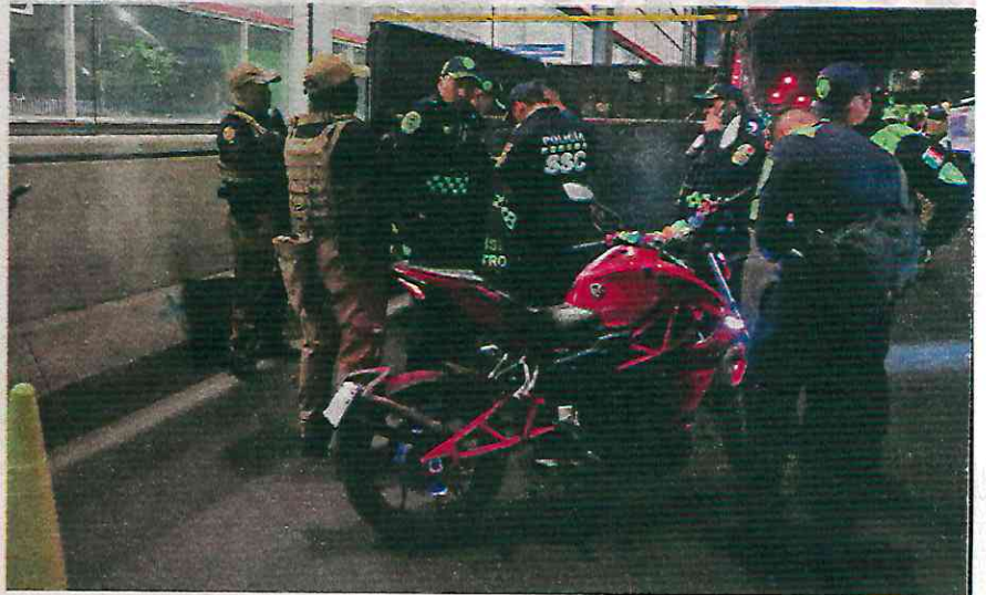
Al momento de realizar un operativo de motocicletas, dos hombres fueron detenidos

Durante dicho despliegue, los efectivos policiales trasladaron 19 motociclistas