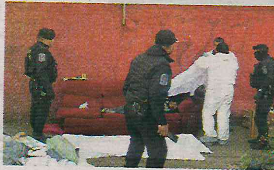
Se incrementó la violencia en la demarcación

Para cumplir con la misión de disminuir los hechos delictivos y la violencia en Xochimilco, la Secretaría de Seguridad Ciudadana (SSC) de la Ciudad de México, contará con el apoyo de la Fiscalía General de Jus-