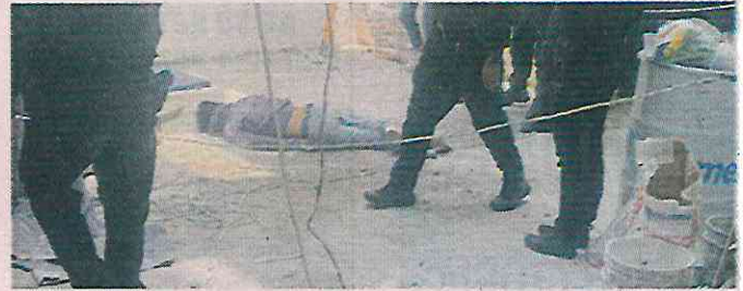
■ En Avenida del Imán está la obra donde ocurrió el accidente.

médicos de una ambulancia, sin embargo, los paramédicos al hacer la revisión médica certificaron que el hombre ya no tenía signos vitales, por lo que dieron aviso a la Fiscalía General de Justicia de