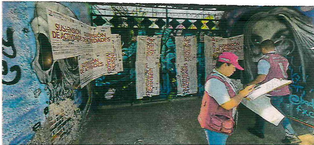
En Azcapotzalco clausuran antro que se hacía pasar como centro cultural, donde se vendía bebidas alcohólicas a menores

- Se observó la venta de bebidas alcohólicas sin alimentos (cervezas, mojitos, azulitos), en una superficie de 360 metros cuadrados.