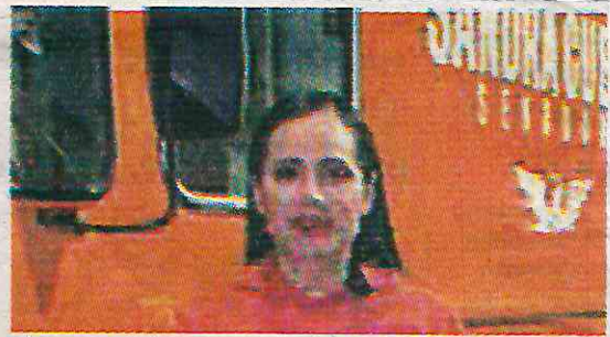
La emecista se caracteriza por echar pleito