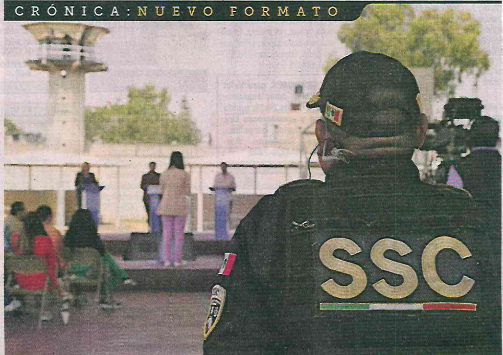
Representantes de los candidatos a la Jefatura de Gobierno acudieron al Centro Varonil de Reinserción Social de Santa Martha Acatitla, al primer debate dentro de un centro penitenciario.

El tema principal fue el sistema de cuidados para la población reclusa y sus familiares; el público,