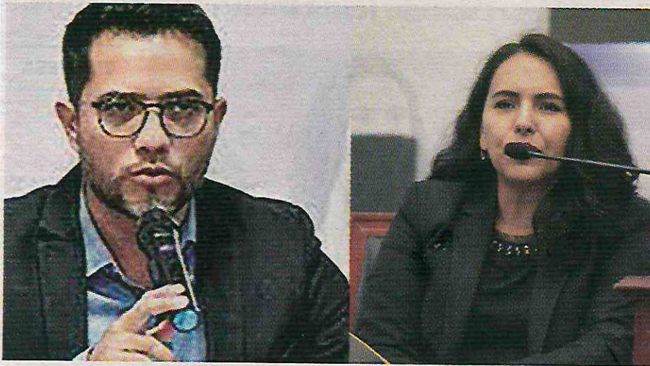
Mauricio Huesca votó para poner mordaza al partido guinda

VOTANTES DE MORDAZA POR EL CÁRTEL INMOBILIARIO FUERON COLABORADORES CERCANOS DE LORENZO CÓRDOBA Y CARLOS UGALDE, QUE OPERARON A FAVOR DEL PRIAN