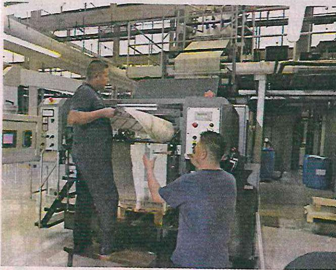
Se tiene previsto que sea entregado el 31 de mayo.