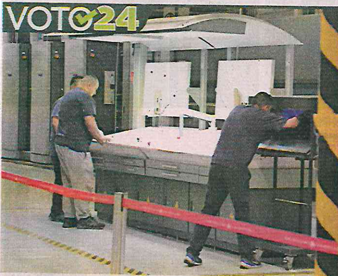
Ayer comenzó la impresión del material electoral.