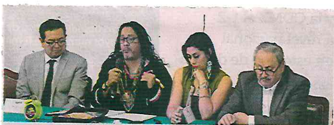
■ Especialistas y legisladores plantearon la necesidad de una regulación local en la materia.

“Nos hemos encontrado con casos de usuarios que, por falta de información, los llevan a prisión, y la ignorancia no puede ser un motivo. Pagar amparos, tampoco”.