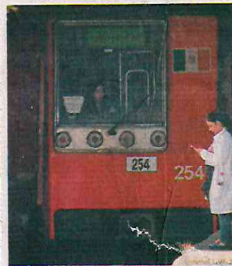
Tras el choque en la L3, agraviados promovieron un amparo.

Rivera González señaló que la omisión atribuida a la mandataria, de realizar "las actuaciones y gestiones, o en su caso, ordenar a autoridades facultadas para verificar el oportuno mantenimiento al Metro, podría poner en riesgo la integridad, no sólo de los promotores, sino de miles de usuarios del transporte colectivo, con lo que se le podrían causar daños de difícil reparación". ●