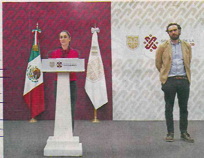
La jefa de Gobierno, Claudia Sheinbaum, dijo que los cambios en la administración y finanzas del Metro no se deben a un mal manejo.

mativa, el Poder Judicial señaló que dicho monto fue dado a conocer por el Ministerio Público al momento de formular la imputación en contra del conductor, "lo cual no constituye en este momento procesal una petición de cobro para el imputado".