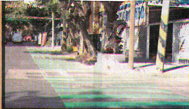
METROPOLITANA. Conectará el municipio de Naucalpan con la alcaldía de Azcapotzalco. Medirá 7.5 kilómetros, en la ciudad, los cuales llevan un avance de 50 por ciento.

Esto con la construcción y ampliación de tres ciclovías. La primera en avenida Camarones, la cual inició