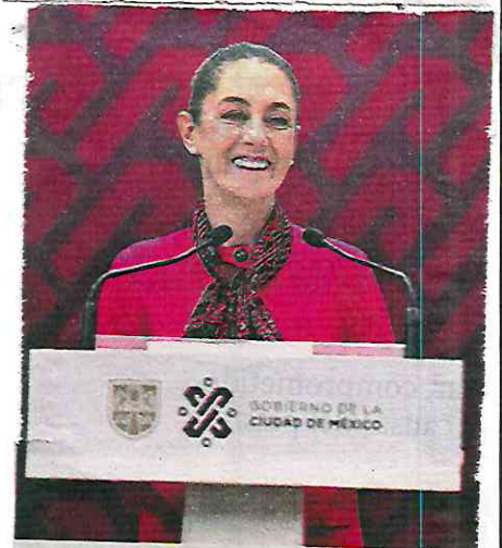
La jefa de Gobierno, Claudia Sheinbaum Pardo

trabajadores del Metro sindicalizados y trabajadores de confianza, quienes bajan a vías por la noche cuando no hay corriente eléctrica para hacer una revisión, corregir cualquier falla e informar de ella.