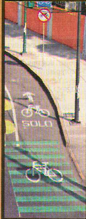
GUELATAO. Conecta al Metro Guelatao con el Trolebús Elevado.