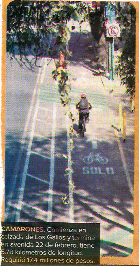
CAMARONES. Comienza en Calzada de Los Gallos y termina en avenida 22 de febrero. tiene 5.78 kilómetros de longitud. Requirió 17.4 millones de pesos.

El nuevo bicarril irá del municipio de Naucalpan a la alcaldía Azcapotzalco, que también tendrá una ciclovia propia. En Iztapalapa y Coyoacán se habilitarán dos más. / 14