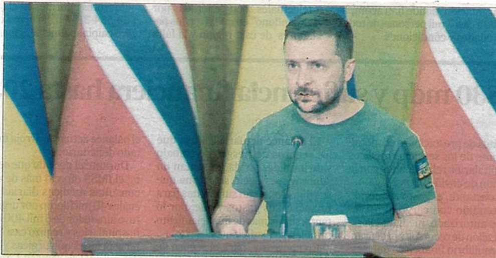
▲ El mandatario ucranio anunció el viernes en Kiev la donación de mil millones de dólares por

http://alfredojalife.com https://www.facebook.com/AlfredoJalife https://vk.com/alfredojalifeoficial https://t.me/AJalife https://www.youtube.com/channel/UCIfxfOThZDPL_cOLd7psDsw?view_as=subscriber https://vm.tiktok.com/ZM8KnkKQn/ Podcast: https://spoti.fi/3uqpT1y