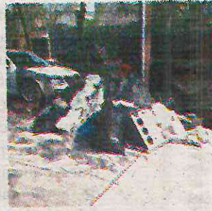
Y genera fauna nociva

Las quejas de los representantes de colonias como Clavería, Nextengo, Santa Lucía, Coltongo y Del Trabajo, son por el exceso de ruido, la acumulación de desechos que van en aumento con la contaminación del aire que provoca la Recicladora de Cascajo, contigua al Parque Bicentenario, pero en la alcaldía Miguel Hidalgo. A ello, los manifestantes chintolos incluyeron el drástico aumento de desarrollos inmobiliarios, que dejan sin agua al resto de la población, en una alcaldía que ya padece la escasez de líquido, en parte por la falta