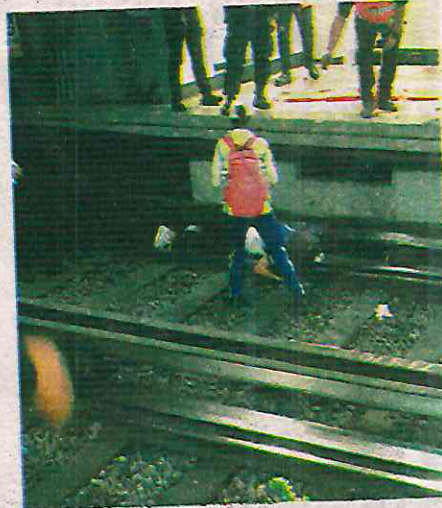
EL STC suspendió el servicio para realizar las labores de rescate del cuerpo

El Sistema de Transporte Colectivo (STC) Metro, mediante su cuenta oficial,