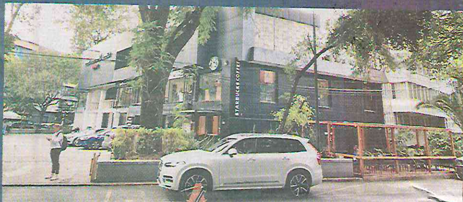
En Galileo 8 se busca el cambio uso de suelo en el Congreso local.