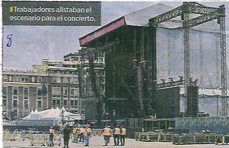
Trabajadores alistaban el escenario para el concierto.

“La Subsecretaría de Programas de Alcaldía y Ordenamiento de la Vía Pública retirará el comercio popular para garantizar el libre tránsito de los asistentes”, informó.