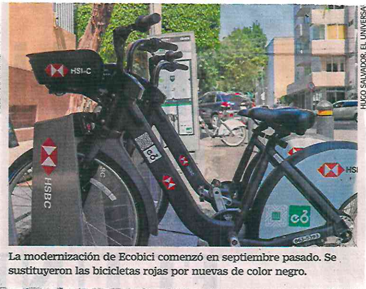
La modernización de Ecobici comenzó en septiembre pasado. Se sustituyeron las bicicletas rojas por nuevas de color negro.

El costo de inversión para ampliar, renovar y operar el sistema Ecobici los próximos seis años fue por un monto de 544.5 millones de pesos. ●