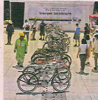
■ En el evento hay juegos didácticos.

Además, resaltó que Ecobici rompió el récord histórico de viajes realizados en un mes en mayo, con 900 mil.