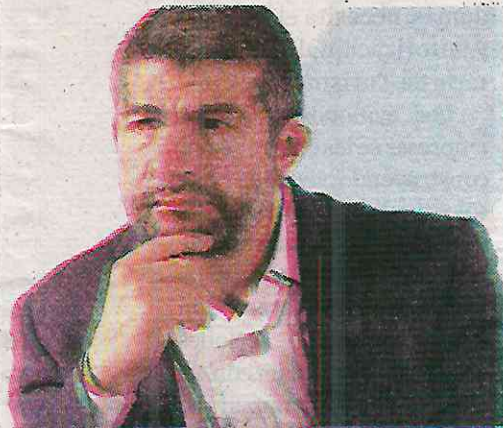
Es poco ético el alcalde de Miguel Hidalgo

“Los Puntos Violeta promovidos en las alcaldías panistas son un engaño y un riesgo constante para las mujeres en situación de vulnerabilidad”, afirmó.