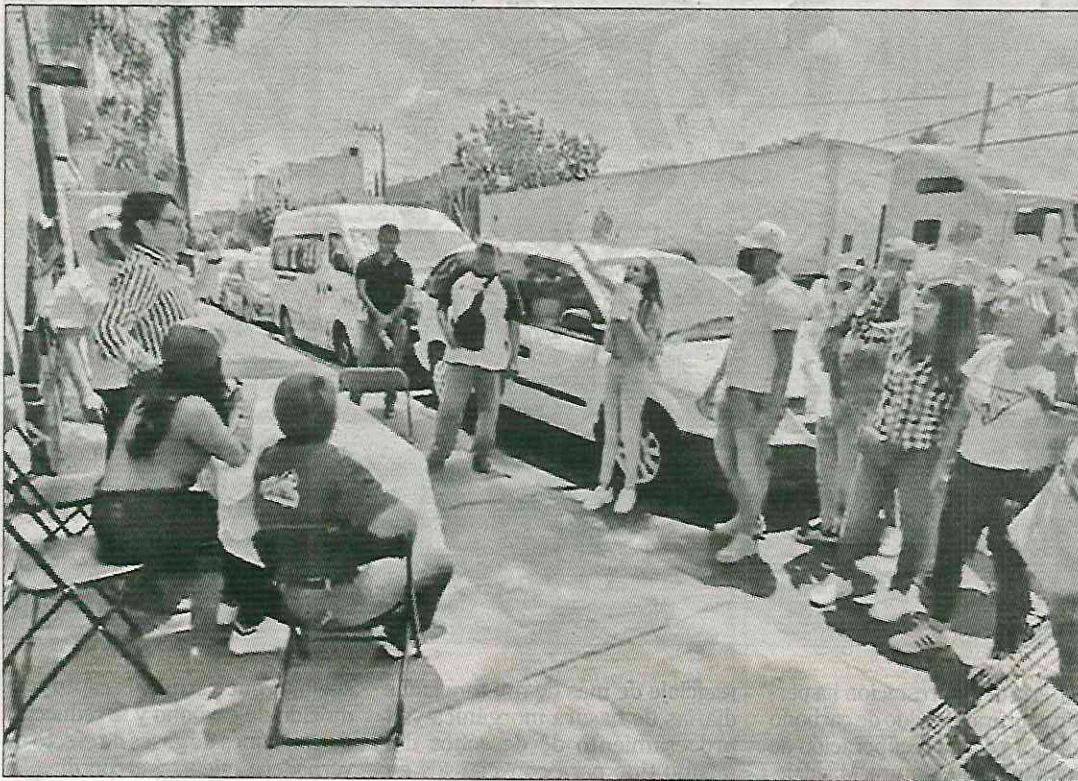
▲ Al menos unos 30 jóvenes expulsaron al diputado panista de la colonia Pedregal de Santo Domingo.