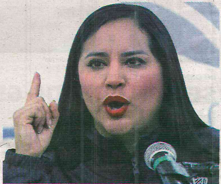
La edil no puede ni con el programa Blindar Cuauhtémoc