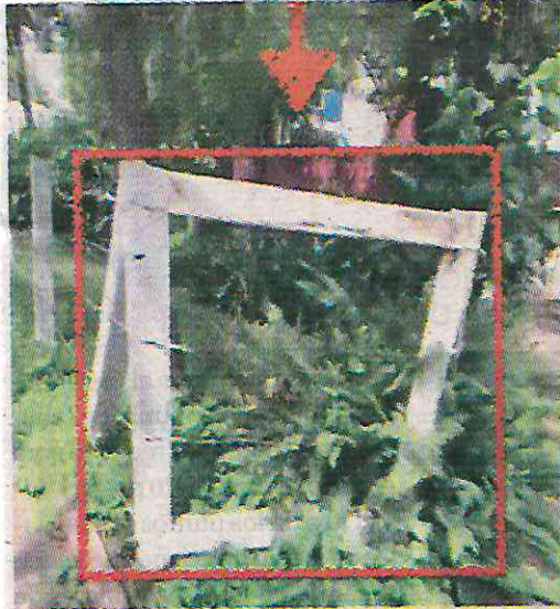
Caballetes con alambre de púas