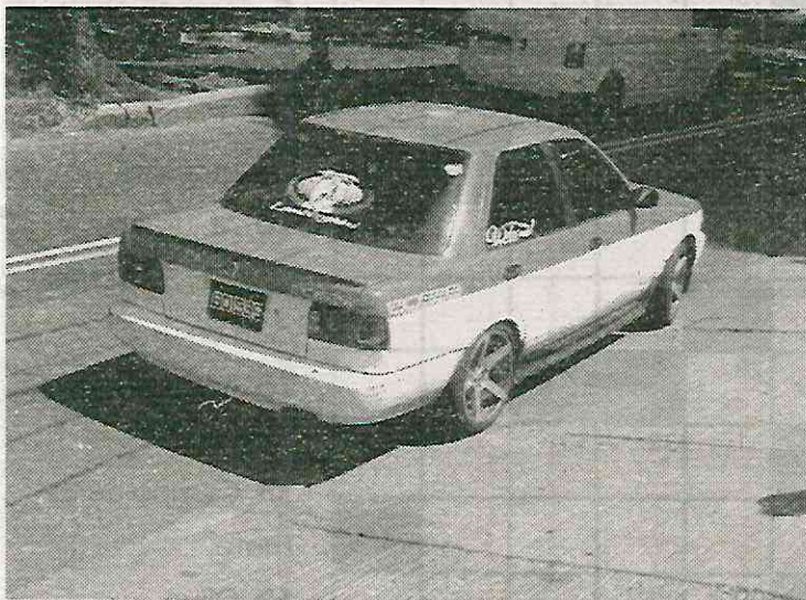
Los delincuentes usan un vehículo que simula ser un taxi seguro

BANDA DE DELINCUENTES OPERA DESDE HACE TRES AÑOS; HACEN DE LAS SUYAS EN LAS COLONIAS LA JOYA, SAN PEDRO MÁRTIR Y SAN ANDRÉS TOTOLTEPEC