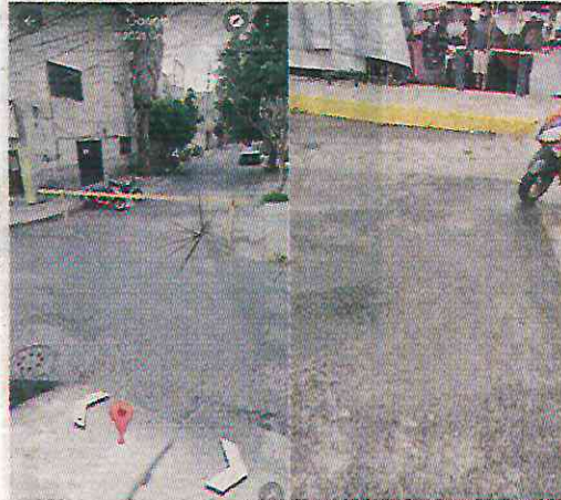
Ahora ya no pueden pasar los vehículos