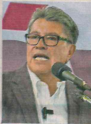
DIANA VALDEZ, EL UNIVERSAL

Monreal Ávila dijo sentirse gustoso de que se construya el Capítulo Zacatecas , tras precisar que en todo el país realizan talleres para capacitar, adiestrar y preparar a los jóvenes para que