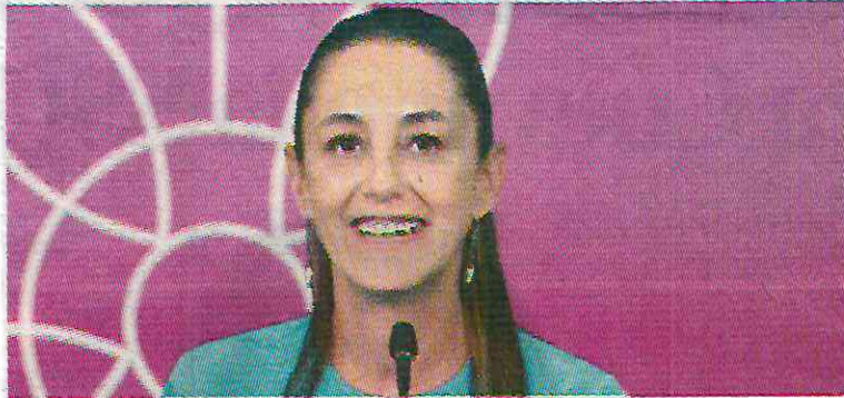
Se resuelven parte de las carencias tras la pandemia