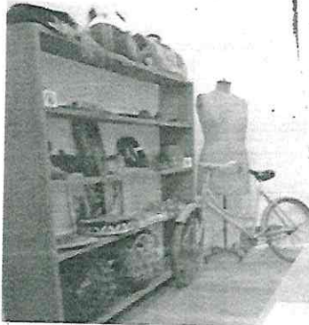
En la casona del siglo XVIII se resguardan más 8 mil 138 libros, 476 obras artísticas y 472 piezas de arte decorativo, así como 50 enseres y muebles

fallecido el 19 de abril de 1998. Parte también importante de los bienes de la pareja son los cinco inmuebles que quedaron inestados. Cuatro en la Ciudad de México: Plinio, Río Guadalquivir, Río Lerma y Porfirio Díaz, y el departamento de París, cuyo destino definirá el Consejo técnico que se conforme con las nuevas potestades de administrador y del fideicomiso, pero que podrían tener por vocación la promoción de la obra de Paz y el estímulo al arte y la creación literaria.