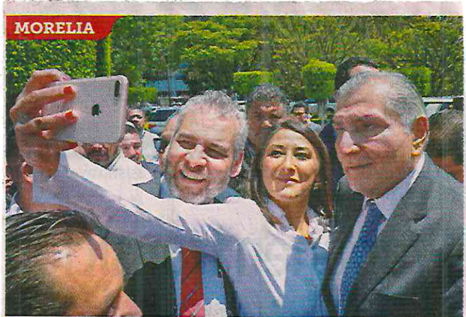
De gira por Michoacán, el titular de Segob, Adán Augusto López, posó junto con el Gobernador Alfredo Ramírez.

El llamado se dio en acatamiento de una resolución del INE, que emitió una medida cautelar para frenar el proselitismo y dispendio en favor de los contendientes.