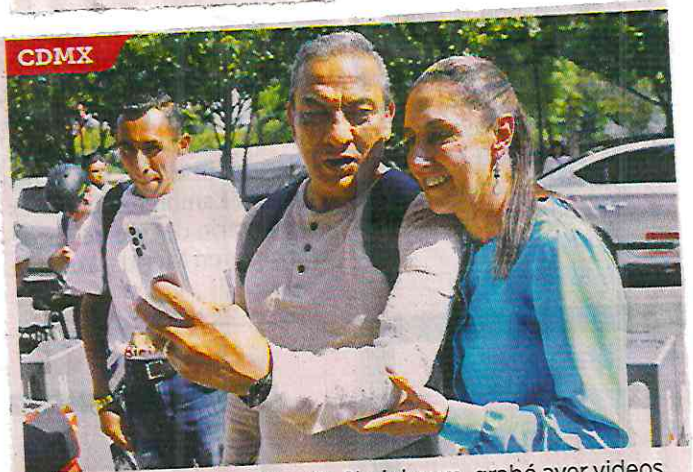
La jefa de Gobierno, Claudia Sheinbaum, grabó ayer videos en la Plaza de la República.

“Nos estamos preparando para recibir a Los Fabulosos Cadillacs en el Zócalo de todas y todos los mexicanos. Que sea buen viernes para tod@s”, escribió en su cuenta de Twitter.