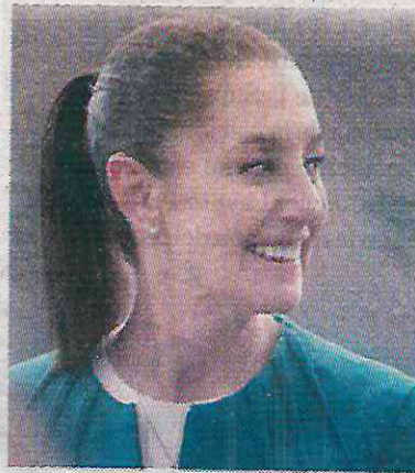
Espera que los ciudadanos gocen