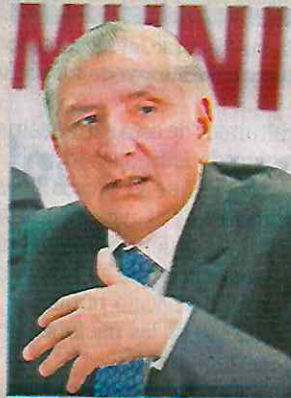
El funcionario dice que no transgrede llamado del INE.

“Yo no estoy haciendo campaña, vengo a un evento oficial. La gobernabilidad se construye todos los días”, explicó el secretario.