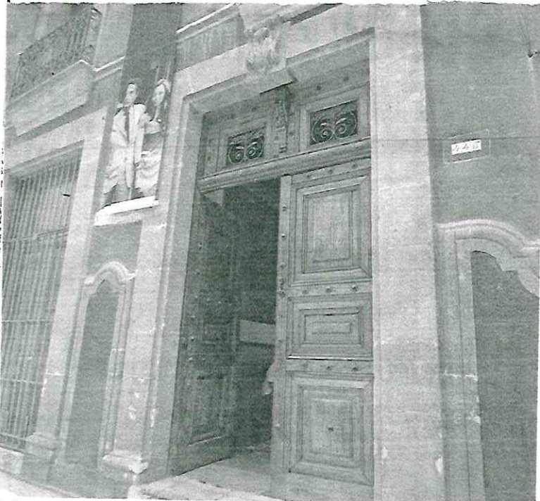
La Casa Marie José y Octavio Paz, ubicada en Tacuba y conocida como "La Perulera", abrió el pasado 31 de marzo; en ella se exhiben piezas del acervo intelectual del Premio Nobel de Literatura y de su esposa.