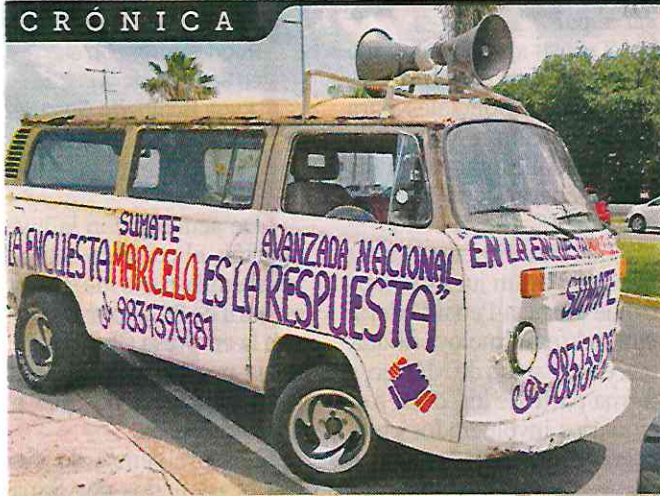
La camioneta modelo 1973 que promueve en Chetumal las aspiraciones del Canciller Marcelo Ebrard.