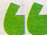
Gráfico: Daniel Rey