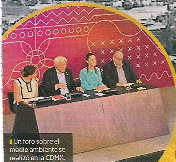
Un foro sobre el medio ambiente se realizó en la CDMX.

La Came tiene atribuciones para revisar temas ambientales diferentes a la contaminación del aire, pero el órgano de Gobierno, conducido por los mandatarios de las entidades, las acotó a la calidad del aire, señaló Páramo.