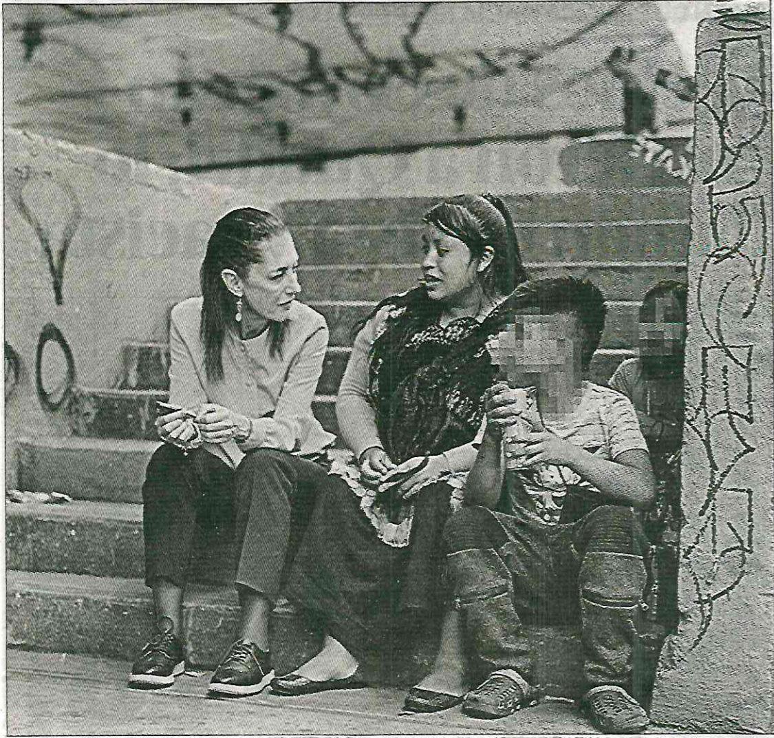
▲ La jefa de Gobierno acudió ayer al cruce de Circuito Interior y la calzada México-Tacuba, donde ofreció apoyo de los programas sociales a una familia recién llegada de Chiapas; también platicó con jóvenes que practican en sus patinetas en la pista que se encuentra en el bajopuente.