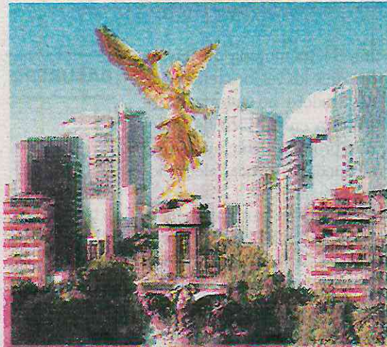
CDMX acumula el 38% del total nacional de IED

CIUDAD DE MÉXICO.- En el primer trimestre de 2023, la Ciudad de México fue la entidad federativa que recibió más Inversión Extranjera Directa (IED), al captar 7 mil 39 millones de dólares (mdd), seguida de Nuevo León con 2 mil 332 mdd y Jalisco con mil 179 mdd, informó la Secretaría de Desarrollo Económico (Sedeco).