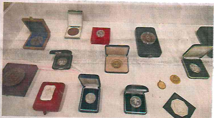
Entre los bienes también destacan 651 piezas de joyería, 64 prendas de vestir y alrededor de 45 medallas y diplomas, como el del Premio Nobel de Literatura que el poeta ganó en 1990.