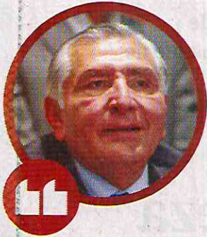
RICARDO MONREAL SENADOR

Yo no estoy haciendo campaña, vengo a un evento oficial."