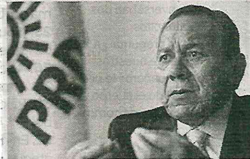
El dirigente perredista criticó a la jefa de Gobierno de la CDMX, Claudia Sheinbaum Pardo

Señalaron que las expresiones del dirigente del Sol Azteca, que rayaron en la misoginia y violencia política de género, no pasaron inadvertidas, por lo que tomarán cartas en el asunto. “Desde la bancada de Morena en el Congreso de la CDMX, lo denunciaremos ante las autoridades. No permitiremos que continúe la escalada de violencia contra las mujeres y de manera particular contra Sheinbaum”.