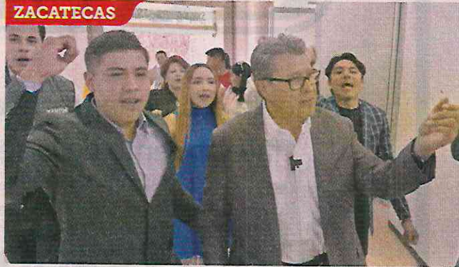
El senador Ricardo Monreal estuvo en su tierra natal, donde asistió a un foro juvenil.

“Monreal, amigo, los jóvenes contigo”, se escucha cuando el coordinador de los senadores morenistas entra al auditorio, donde dirigió un mensaje a los muchachos, a quienes sugirió hacer a un lado la indiferencia social.