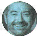
JUAN RAMÓN DE LA FUENTE

» Como ya es costumbre, las corcholatas presidenciales acudirán este sábado a una ceremonia de cambio de gobierno. A la toma de protesta de Américo Villarreal asistirán el titular de Segob, Adán Augusto López ; la jefa de Gobierno, Claudia Sheinbaum ; el canciller Marcelo Ebrard , y el senador Ricardo Monreal .