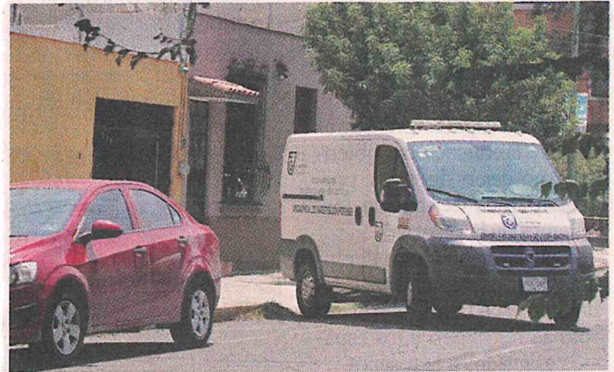
Una mujer de alrededor de 60 años fue asesinada en un inmueble de la Colonia Industrial.

Hasta julio de 2022, la Fiscalía General de Justicia (FGJ) había registrado 40 casos de feminicidio en la Capital.