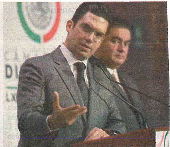
Afirman que tenía hasta su Centro de Operaciones

Asimismo, la funcionaria también coincidió en que buena parte las irregularidades en materia de construcción dentro de la alcaldía Benito Juárez, se empezaron a registrar bajo el gobierno delegacional del panista.