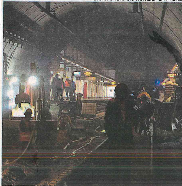
La zona subterránea también será modificada