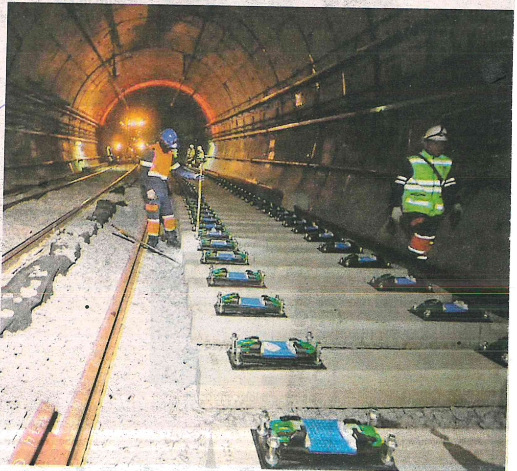
El gobierno capitalino decidió aportar una parte del recurso para cambiar la sub base de una zona que está ya muy húmeda, y realizar los cambios necesarios

“Ustedes pueden ir ahí a Tláhuac que –lo he dicho varias veces–, parte del problema de la reconstrucción de la Línea 12 –vamos a ponerlo así–, porque no solamente es el tramo de la caída de la trabe, si no se va a reforzar todo, por los problemas de origen que tenía. Entonces se está re-