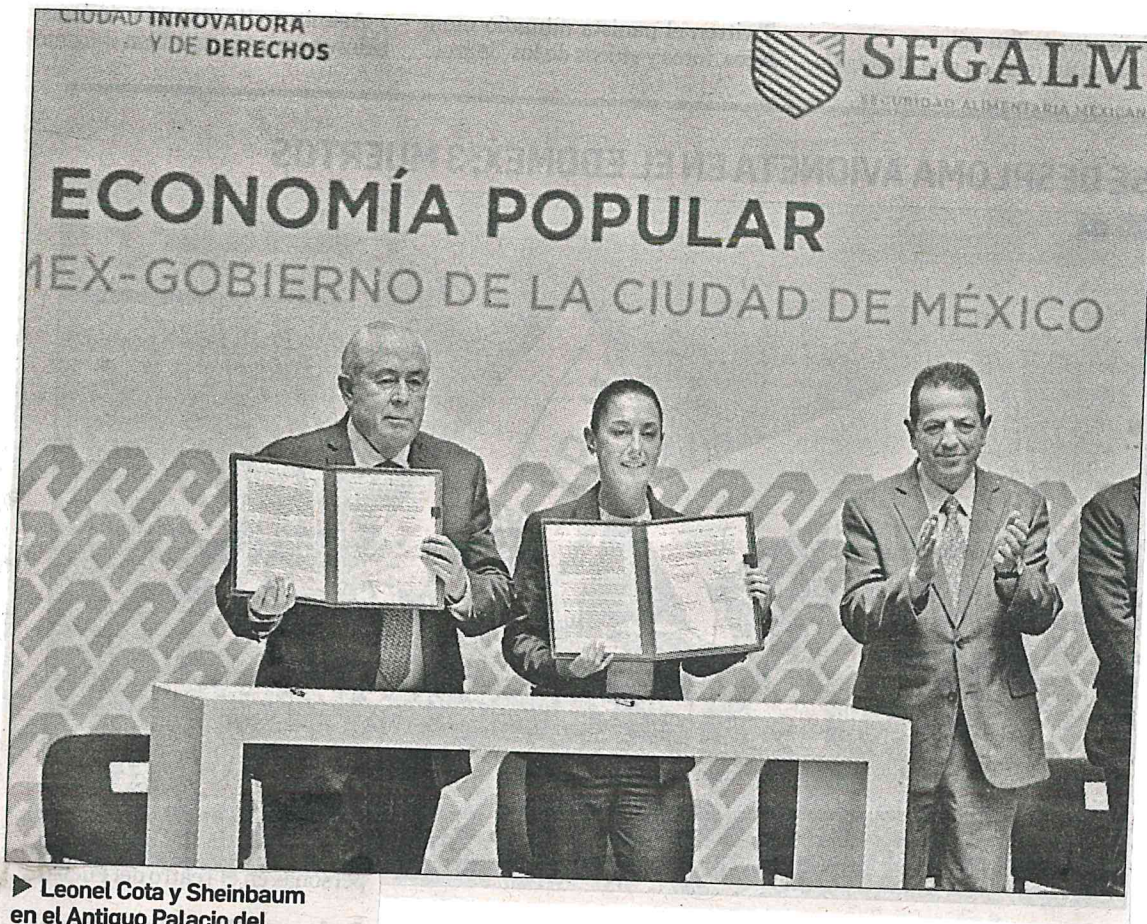
► Leonel Cota y Sheinbaum en el Antiguo Palacio del Ayuntamiento.