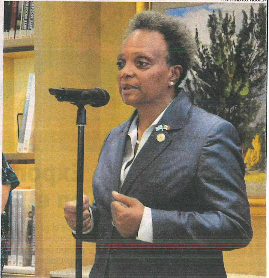
La alcaldesa promueve la inversión extranjera en Chicago

“Le mostraremos el trabajo que estamos haciendo para fortalecer las pequeñas y medianas empresas afroamericanas en nuestra ciudad. Creo que es una oportunidad tremenda para nosotros para construir nuestra relación y compartir, estoy segura de que hay otras cosas que po-