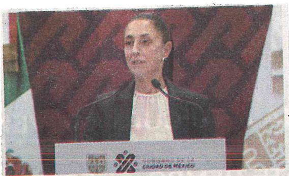
Se investiga vínculo de familiares

La jefa Claudia señaló que aún no se tiene el número de familiares que han sido llamados a declarar, por lo que pidió a la FGJCDMX que informe al respecto.